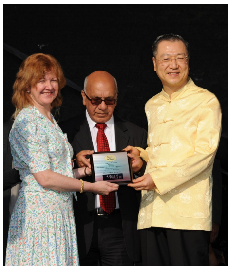
◇ 2012年英国伦敦世界宗教联合会 “世界和平奖（佛教）”

而心灵法门恰恰填补了这两项空白，台长所著白话佛法既具有积极回应现实生活问题的特征，又将浩如烟海的佛教典籍用科学思辨的方法加以提炼，将适用于现代社会的教义，以白话方式与生活中的常见事例结合起来加以诠释，让无数人欣然信受并明理致用，最终弃恶从善。最主要的是，心灵法门做到了上中下三根普被，绝大多数的普通人，他们原本对佛理并没有太多的了解，甚至还有非常世俗的要求，对此，台长相机采用了大小乘结合、次第成就众生的方法，一是用众生喜闻乐见的方式来弘法，即以所谓看图腾的方式直接道出前因，让人在震惊之余即刻明白因果不昧的天理，