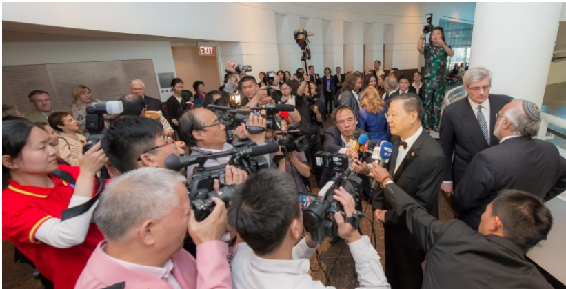
◇ 卢军宏台长作为世界和平大使在国际社会弘扬中华文化受到各国媒体关注

当然，我们海外弘扬佛法人意识到，要提升公民的道德水准，其实一味道德教化，难免有如无根之木，难见成效。对祖国这样一个具有数千年未曾中断文明史的国家而言，要提升广大人民的道德水平，这就需要在传承中华优秀传统文化的基础上，构建完善让社会民众接受奉行的价值体系，构筑现代国家公民之间的公共理性，从而实现道德回归，促进社会和睦安定，这就是实现伟大复兴中国梦的关键一环。因为，一个有信仰的民族才会自我约束，任何一个有信仰的普通公民才会自设底线。止恶行善，不仅是每个人的期许，更应该成为每个人的本能。其实，不论哪种信仰，都告诉我们谨言慎行，看住被欲望拨乱的心，这也是修为的根本，从