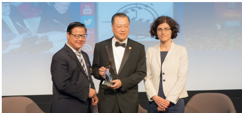
◇ 卢军宏台长在美国宽容博物馆获得颁发“文化和平杰出贡献奖”

实现中国梦，必须凝聚数千万海外华人华侨的力量，依靠大力弘扬中华民族的优秀传统文化。传统文化是民族文化价值认同、民族成员精神联系的纽带。中华文明延续数千年而不衰，中华民族在磨难中日益强大，走向复兴，其重要的价值根源之一，便是对中华民族成员的自觉认同。近年来，海外华人华侨分布地区越来越广，知识、专业层次不断提高，精英辈出，他们促进新兴产业发展，引导外资进入，带动中国企业国际化，推动中国科技创新发展，同时，他们也