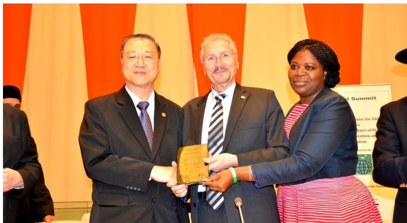
◇ 卢军宏在联合国举办的世界和平会议上获得“世界和平教育大使”

国的安定团结带来不小的负面影响。这些人，这些群体，他们心里没有丝毫可以敬畏的东西，他们没有可以支撑的精神支柱，所以，他们一旦遇到危及到自身利益的时候，就会毅然放弃道德和良心，无法无天，为所欲为，甚至丧失基本的道德底线和做人的良心，干出一些丧尽天良甚至对社会乃至对祖国严重危害的事情。“只要活着的时候法律制裁不了我，死了也没人管了”，这就是现代人的普遍心态。可以说，信仰缺失成了目前一些民众精神空虚、行乱作恶的一大重要原因。