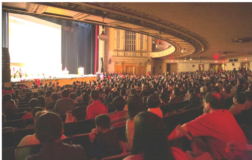
◇ 2014年美国旧金山大型弘法演讲会

从当前来看，建设和谐社会的最大矛盾之一，就是社会道德滑坡。各个国家均存在了不同程度的国民道德缺失而造成的社会不稳定现象。从近年来的毒奶粉、摔死小孩、地沟油、乃至大肆贪污受贿等事件现象来看，均反映出很多的人的心理出现了不健康状况，从一个个事件的负面影响也可以