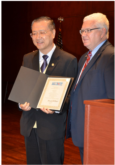
◇ 卢军宏台长在美国国会举办的世界和平会议上获得“世界和平大使”殊荣

充分发现、发扬和发掘佛教的正面、积极、向善的功能，通过大家自发自愿、春风化雨的方式，让断恶修善入住每个人的心中。当前，全世界学习阅读卢军宏所著的《白话佛法》的人逾千万，正是白话佛法所倡导的价值追求、做人之道、道德精神、君子人格等，对于匡正社会风气和教化民众产生了积极的作用。“学佛人首先根据当地的法律，法律认为合法你就做，不合法你就不要做，要记住，骗人的事情不能做；不骗人的事情都能做；赚钱赚过头的事情不能做；对得起良心的事情都可以做；对不起良心的事情不要做。”这段话是卢军宏在2012年10月19日的节目问答中对听众的严肃告诫。诚然，如果世人都有了敬畏之心，那样人人自然都有自律心，昧良心的事很少有人敢做了，社会将更加公平和谐，国家和社会将会更加进步美好，更重要的是，正是基于这种信仰，个人命运前途可以融入到相对“无限”的国家民族发展中，个人的生命可以不再虚