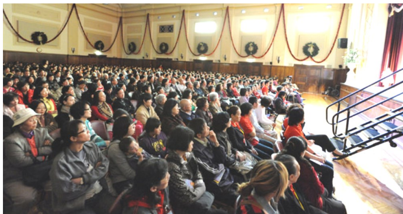
◇ 澳大利亚墨尔本弘扬佛法演讲会

许多人对于佛法，耻于谈及福报，更不屑于在学佛之中求现世功利。其实不尽然，佛法不是不食人间烟火的魏晋名士清谈，求得解脱是无上目标，灭苦获安是现实之道。就绝大多数人而言，灭苦除障之后，才有可能发心精进勤修。生、老、病、死，怨憎会、爱别离、求不得，及一切五蕴之