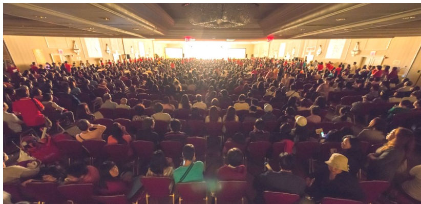
◇ 2014年美国纽约弘扬佛法演讲会

诉我们，邪见过失罪业为十恶业中最重，重于杀生。因为杀生只断一切众生之色身生命；而邪见则断一切众生之菩提慧命。在正法衰微的当今社会中，但凡有人宣说正信佛法，为众生种下解脱的种子，都值得赞叹和随喜，何必区分缁衣和白衣？障碍他人受益，其后的苦报不堪设想；狭隘地把在家居士弘法视为异类，则是完全违背了佛陀的教诲。故阻碍证量居士说法，实为邪见过失之罪。