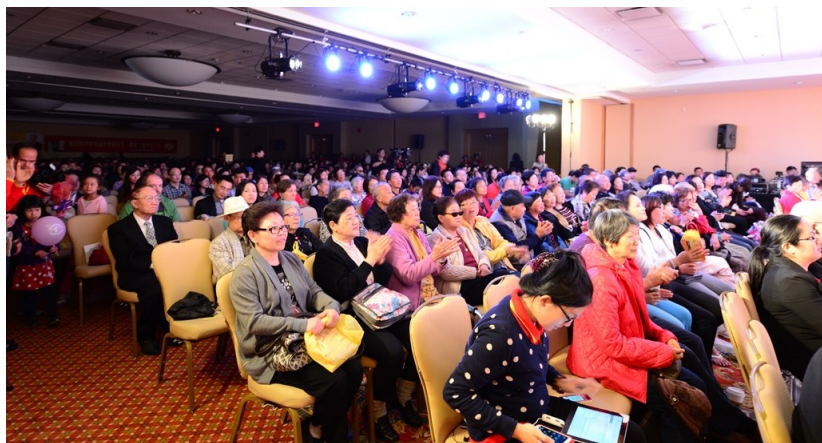
◇ 加拿大温哥华弘扬佛法大型演讲会

无缥缈。在精进的修行中，越来越多的修行人时时刻刻感觉到菩萨的存在和加被，会真的明白“举头三尺有神明”，从而如履薄冰的看住自己的身口意。