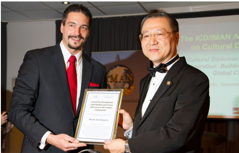
◇ 2013年德国柏林“全球文化外交峰会”授予“世界和平杰出贡献奖”