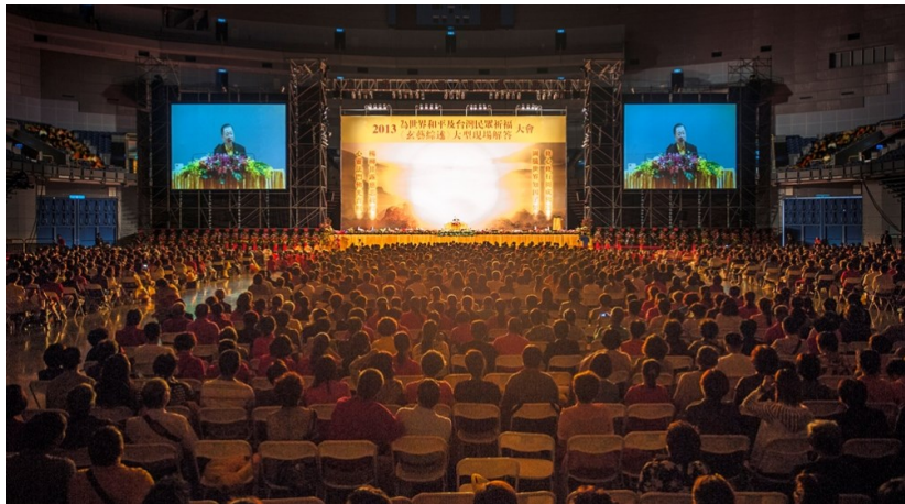
◇ 2013年台湾世界和平万人祈福大会

入世的菩萨道精神，菩萨怎能忍心看众生在战火纷飞之中生命饱受威胁，受苦受难，流离失所？菩萨心就是众生心，为了可以让众生离苦，菩萨可以舍去一切救度众生！从另一角度来说，中国佛教是爱国的宗教，历史上佛教始终把护国作为自己的宗旨之一，把“报国土恩”作为内心修炼的重要内容！正是秉承佛教这一理念，澳大利亚的卢军宏台长，多年如一日，不辞艰险、不怕困难、不顾自己，无私忘我地弘扬中国传统文化和佛教的心灵法门，告诉越来越多的人要明白热爱和平、心灵祥和，用良心做人做事，遵纪守法，更加感恩国家、感恩社会，普及佛教“慈悲”“平等”的观念，同样为维护世界和平做出了应有的贡献。