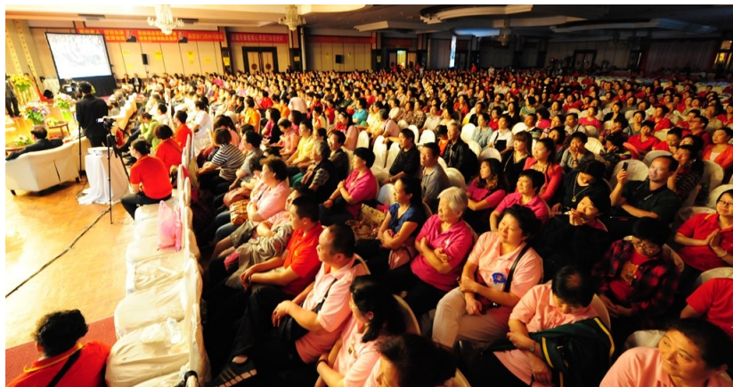
◇ 2013年泰国弘扬佛法大型演讲会