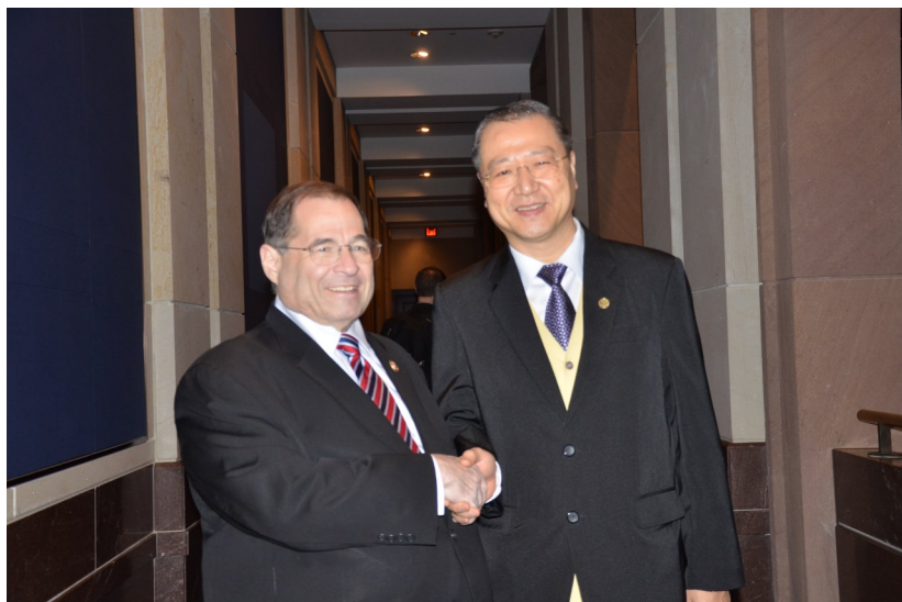
◇ 卢军宏台长与美国国会议员合影

的心灵法门，是方便现代人群修行佛法的一种方法和门径，它针对社会普遍存在的心理亚健康状态，教导人们用佛法领悟人生真谛，激发智慧和自信的能量，实现心灵的自我调完善与解脱；用“念经，放生，许愿”三大法宝，治愈心灵创伤，拥有健康的心态和高尚的心灵，解决人生烦恼和痛苦，消除憎恨，实现家庭和睦，社会稳定，提升人民的幸福指数；通过更深层次的修学，明白人生意义，在有限的生命中，以佛法的智慧去除贪欲和执着，以菩萨精神自利利他，报效国家；进而消除心灵孽障，积功累德改变命运，以禅的智慧提升精神境界，去追求生命真正的解脱。——以人间佛教的思想为指导，在做人的基础上修菩萨行乃至证得无上圆满，这就是心灵法门真正的宗旨与阶梯修学的最终目标。