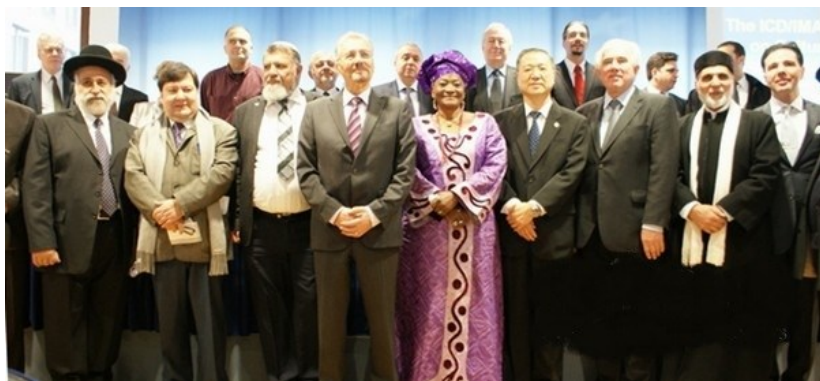
◇ 卢军宏台长在德国柏林参加和平会议与世界各国政要和平人士合影