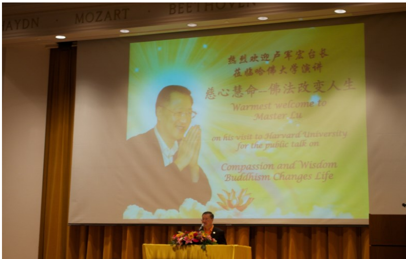
◇ 卢军宏台长在哈佛大学演讲

心灵法门修学十项原则第一条开宗明义指出：拥护中国国家统一，民族团结，坚定的拥护党中央，热爱众生，热爱和平，反对战争。同时，明确反对各种形式的借佛敛财、封建邪教迷信和个人崇拜，要求学佛人尊重一切宗教和法门，不参与任何不利于团结的政治话题、非法集会。卢军宏台长提倡：心灵是锁，法门是钥匙，用钥匙打开心灵的锁，这就是心灵法门的主要理念。他用正信佛法作为消除人类劣根性的济世良药，使众生明心见性，去除贪瞋痴、勤修戒定慧，自度度人，自利利他，化解一切不良恶缘，以正信正念指导正行。心灵法门以简捷、殊胜的修学方法，度化无数在家信众深入佛门，通过修心修行，在人间消除孽障、减少痛苦，