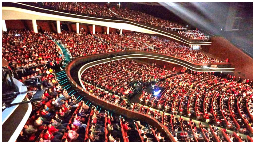
◇ 2014年新加坡万人弘扬佛法大型演讲会

时代呼唤人类爱好和平的本性，时代呼唤人类的良知。如今，当代大德星云法师提出“人间佛法”、卢军宏台长提出“佛法人间化”，其核心期望，就是祈盼用中华传统文化的智慧，教化全世界更多的人热爱和平、心灵祥和，用良心