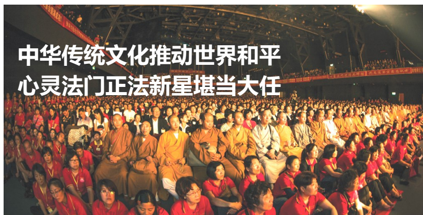
2012年香港弘扬佛法大型演讲会

2015年是中国人民抗日战争暨世界反法西斯战争胜利70周年，不仅在中国，全世界都兴起了一股纪念热潮，全世界热爱和平的人民，都深知这和平来之不易，都想要把这珍贵的和平成果保持和延续下去。