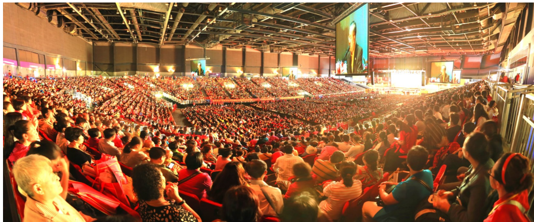
2014年香港30000人弘扬佛法大型演讲会