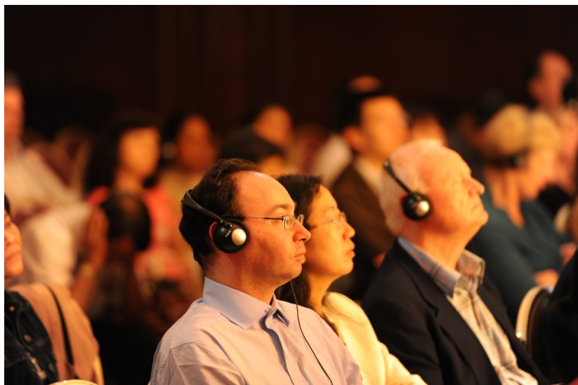
◇ 2012年英国伦敦大型弘法演讲会

“我们比历史上任何时期都更接近中华民族伟大复兴的目标，比历史上任何时期都更有信心、有能力实现这个目标。”习近平总书记观察到这一伟大的契机正越来越近，作为千千万万中华儿女的一员，我们难掩激动和自豪，我们有幸生逢一个伟大的时代，我们坚信，在英明的习主席的领导指引下，我们优秀的中华儿女和海外的炎黄子孙，必将攀登在世界之巅；我们优秀的中华文化，必将深刻的影响造福全世界；我们的祖籍国民族，必将如愿实现伟大复兴的中国梦！我们的祖籍国民族，必将如愿实现伟大复兴的中国梦！