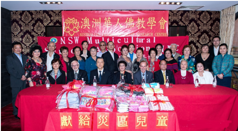
◇ 澳洲华人佛教学会慈善捐赠仪式

他让世界欣赏、体悟、接受中国博大精深的佛教文化，使当代中国精神和价值观为世界所认识和接受。他倡导的心灵法门也肩负着担任国家文化走向世界的和平使者职责，在中华佛教文化与不同文明之间的沟通与交流过程中，传播正法，广结善缘，对推进中华优秀文明走向世界做出杰出贡献。近年来，台长受全世界三十多个国家和地区邀请，举办约五十场《玄艺综述解答会》，弘法足迹遍及欧亚，因此荣获联合国授予文化教育大使、世界宗教联合大会授予世界和平大使、世界和平奖（佛教），以及英国国会上议院颁发的英联邦民族社区特别贡献奖等多项殊荣，并登上了世界学术巅峰哈佛大学的讲坛；卢军宏台长更是受到祖国国家主席江泽民、胡锦涛和李克强总理的接见，并荣登中国新闻出版