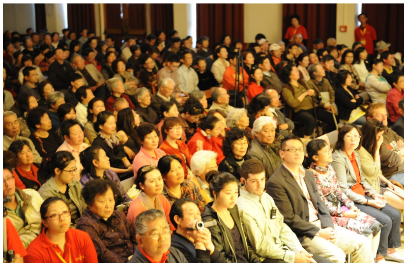
◇ 新西兰弘扬佛法大型演讲会

有人宿世颇有善根，可惜却以研究哲学的心态来学佛，查找经典，多方论证以求所谓“正解”；也有人把佛法知识皮毛当茶余饭后闲聊话题，点缀生活，自认境界非凡，以期博得别人仰慕赞叹。混淆佛学与学佛，将无端生出种种障