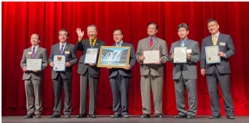
◇ 卢军宏台长在美国洛杉矶获得六市政府授予慈善和平奖项

十多年来，卢军宏和他的弘法团队在全世界奔走相告，创建心灵法门和弘扬白话佛法的发心和愿力，就是要帮助现代人收获心灵世界真正的自在、清净，教化民众要懂得善待他人，要以慈悲心、感恩心在生活中关怀人生、觉悟人生。其方法简单明了，直指人心，就是通过在学习工作之余，积极摒弃不良嗜好，同时通过念经、修心、修行，来提升觉悟，焕发全世界民众爱好和平的本性和良心。可以看到，心灵法门的理念效应，对推动世界和平和谐具有划时代的历史意义！这也是在短短几年之内，全世界学习心灵法门、阅读