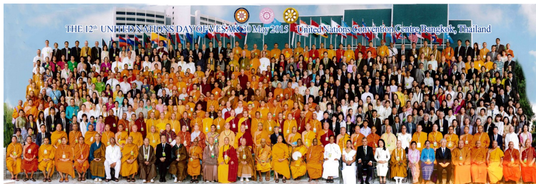
世界和平大使、佛教心灵导师卢军宏台长作为特邀嘉宾出席2015联合国卫塞节庆典活动，与各国政要、佛教领袖大合影