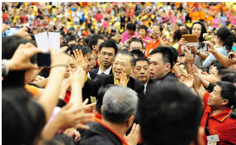
◇ 香港台长受到两万佛友的热烈欢迎

做得好的人一定是一个学佛学佛学得好的人。他说：“学佛就是要好好做人，做人做得好就是学菩萨，人都做得不好学什么菩萨？浩然正气，浩浩乎天地之间，人就是要顶天立地。”特别是他著的《白话佛法》，提倡佛法生活化，教导人们将佛法用在当下生活中改变命运。因其使佛法与生活紧密结合，使众生得以在生活中修行，在修行中生活，极其符合现代社会人们高强度快节奏的生活方式。