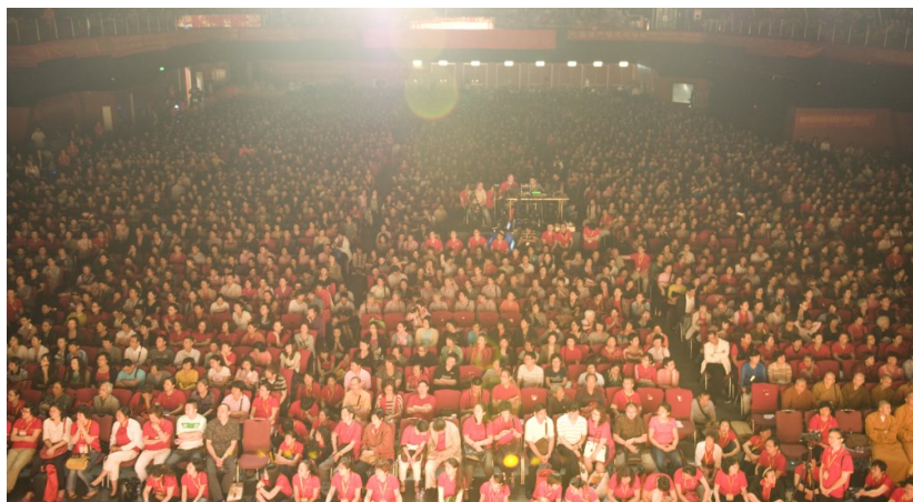
◇ 2012年香港万人弘扬佛法大型演讲会

践行“人类命运共同体”，中国的担当，更是实实在在的行动。大到两带一路、亚投行的建设，小到尼泊尔地震、也门战事的援助国际友人；从为促进地区和平、稳定、繁荣，到灾难面前互相扶助，中国，为促进世界各国各地区实现和平发展共同发展，展现出了让世人为之一振的胆识和气魄。2015年4月22日在亚非领导人会议上，习近平发表了