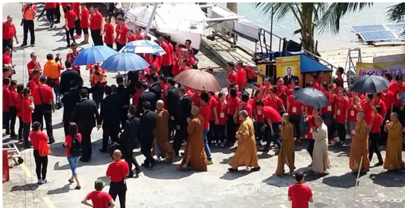
◇ 2014年新加坡卢军宏台长带领法师举行千人放生活动