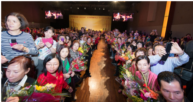
◇ 2015年9月法国巴黎大型弘法演讲会